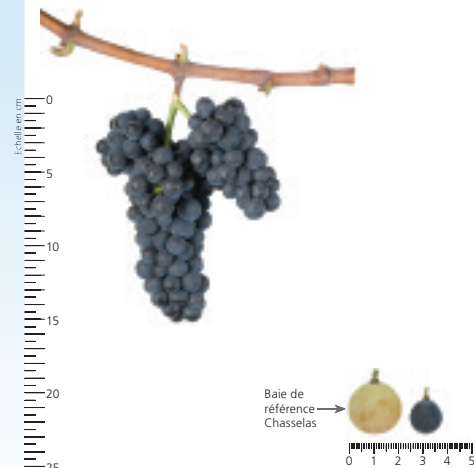
Baie de référence Chasselas