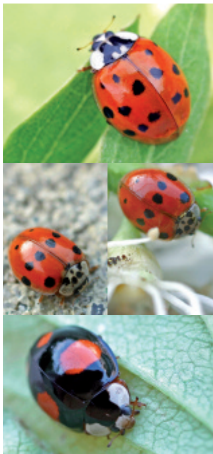
Fig. 2. Trois formes d' Harmonia axyridis présentant un pronotum avec taches en M (haut), pattes de chat (centre) et bandes noires et blanches (bas).

H. axyridis est une grande coccinelle de 5 à 8 mm, dont la coloration des élytres peut varier de manière importante (fig. 2). En Suisse, la plupart des exem-