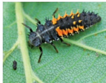
Fig. 3. Larve d' Harmonia axyridis.

L'identification des larves est plus facile. Celles-ci mesurent près de 10 mm et sont couvertes d'épines souples. La coloration est habituellement noire à gris-bleu foncé et deux bandes dorsales parallèles orange figurent sur les segments abdominaux 1 à 5 (fig. 3). Les éventuelles captures documentées (lieux exacts, plante-hôte, dates...) de ces insectes doivent être annoncées auprès du CABI (René Eschen et Marc Kenis, CABI Switzerland Centre, rue des Grillons 1, 2800 Delémont, 032 421 48 70, e-mail: m.kenis@cabi.org).